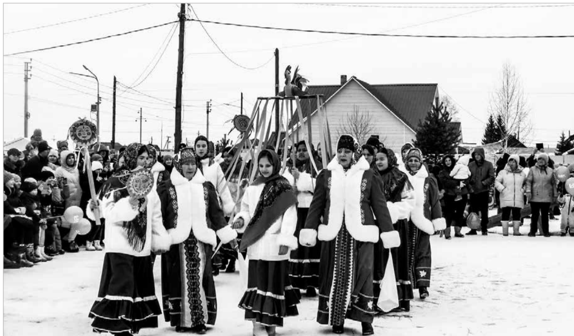
Традиционное народное гуляние – Широкая Масленица – прошло 17 марта в Хомутово.

С раннего утра в этот день на территории спортивного комплекса кипела работа: разворачивались торговые ряды, выставки, полным ходом шла подготовка к проведению праздничных мероприятий.