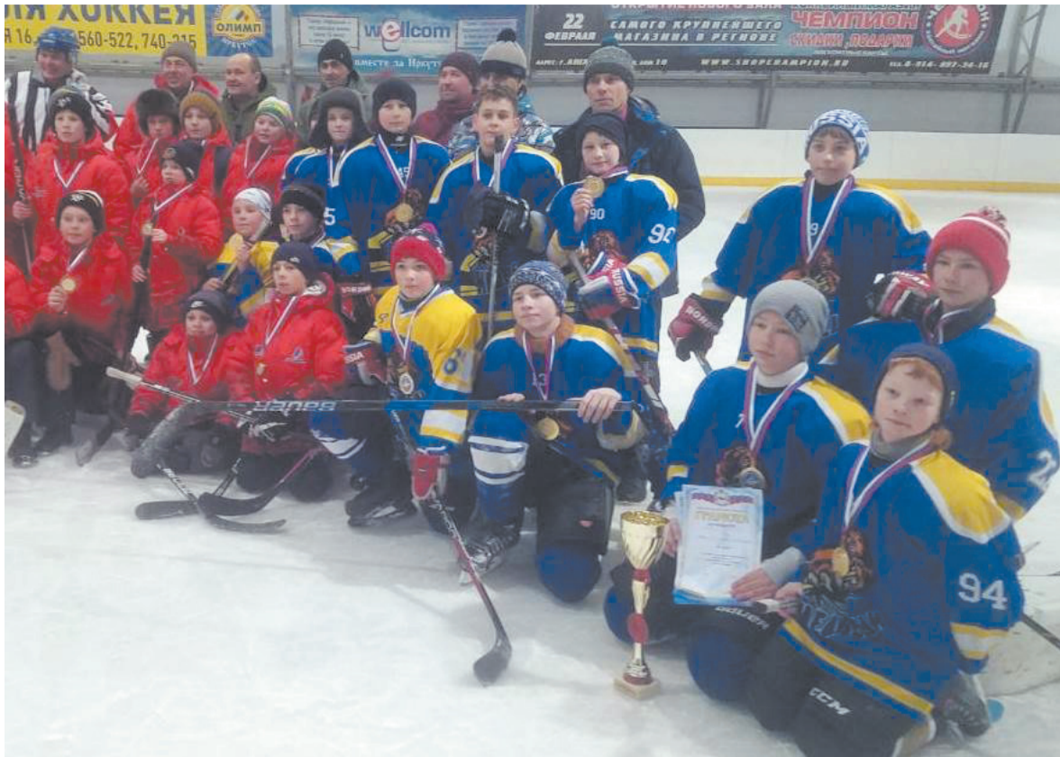
Победители турнира «Золотая шайба»: ребята из Мегета (2 место) и Хомутово (1 место).

Команда «Медведи» из Хомутовского муниципального образования впервые стала победителем областного турнира на призы Всероссийского клуба юных хоккеистов «Золотая шайба» имени А.В. Тарасова.