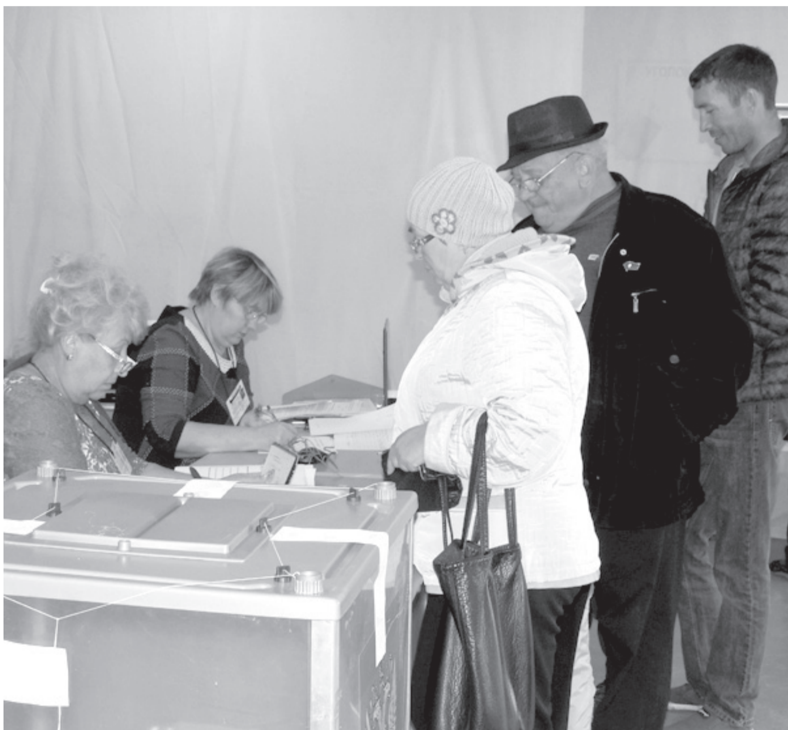
На избирательном участке в школе №2.

10 сентября состоялись муниципальные выборы Главы и депутатов Думы 4-го созыва Хомутовского МО. Итоги подведены, и сегодня мы знакомим своих читателей с результатами.