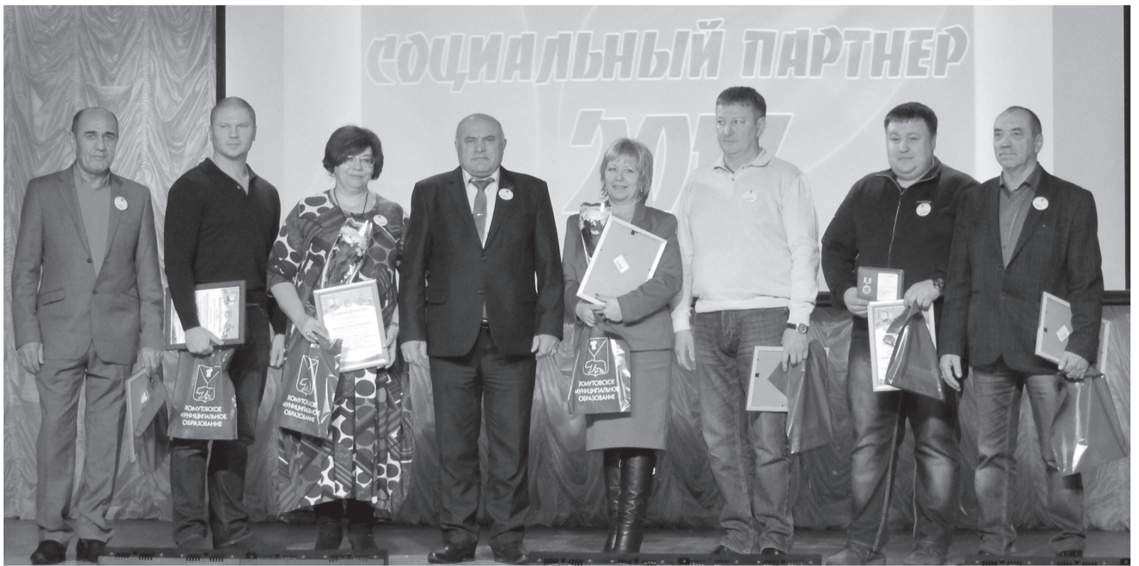
Чествование в номинации «Социальный партнер»