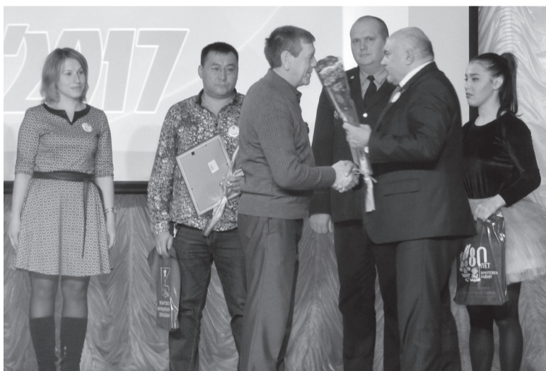
Поздравление в номинации «Надежная защита»