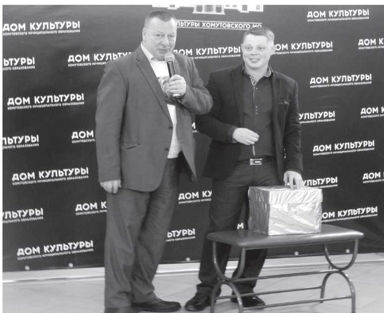
Во время аукциона мог выступить каждый!