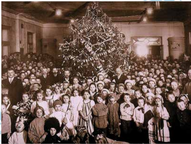
Новогодний праздник. Фото 1940 г.

Слово «коляда» мы не знали, у нас говорили «славить». Молодежь наря-