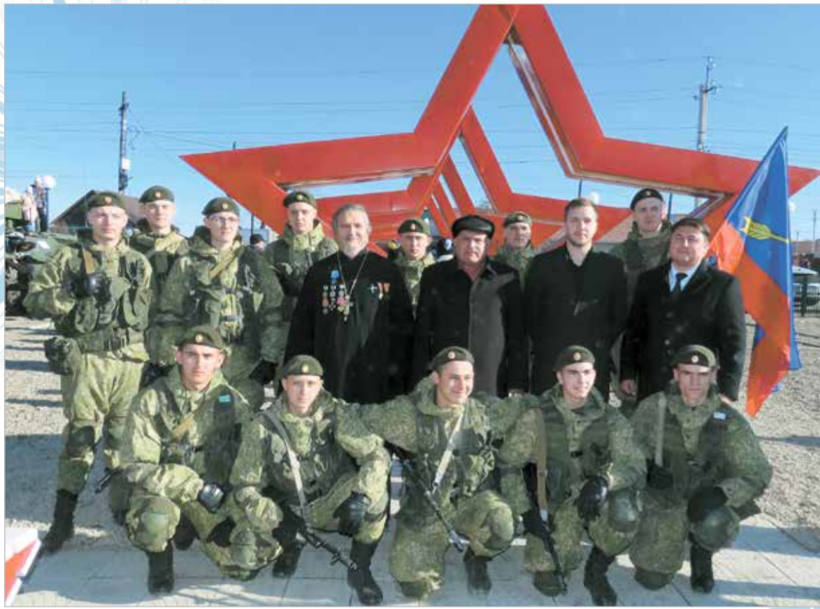
На открытии парковой зоны «Патриот»

2. «Благоустройство сельских территорий». В рамках реализации инициативных проектов граждан, прожива-