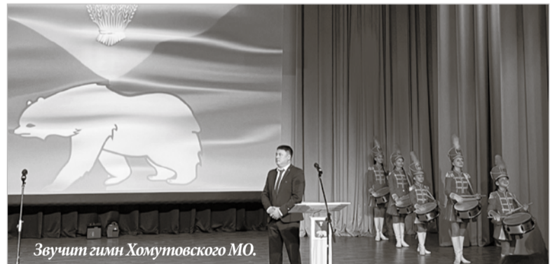
Звучит гимн Хомутовского МО.