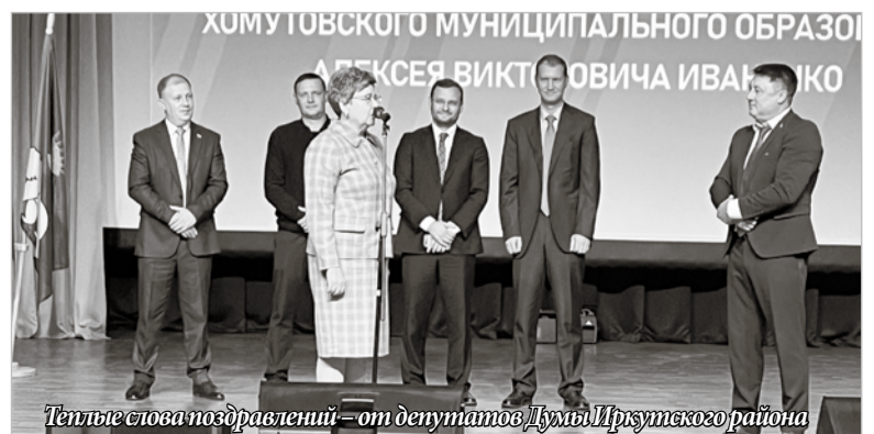
Теплые слова поздравлений – от депутатов Думы Иркутского района