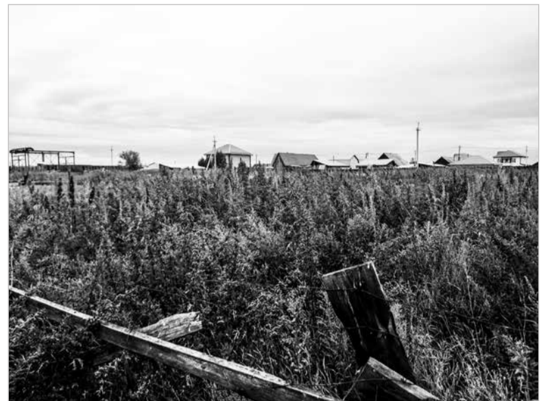
с. Хомутово, ул. Производственная.

- пп. 9.4. Собственник, владелец домовладения обязан своевременно уничтожать на прилегающей территории сорную растительность и карантинные сорняки, производить своевременный покос травы; - пп.12.3.1. Владельцы земельных участков обязаны не допускать выжигание сухой растительности, соблюдать требования экологических, санитарно-гигиенических, противопожарных правил и нормативов;