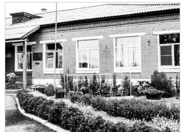
1 место – Хомутовская средняя общеобразовательная школа №2