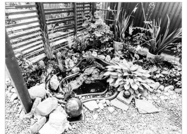
1 место — с. Хомутово, ул. Брусничная-36.