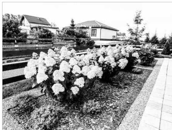
2 место — п. Кантри, д. Куда, ул. Рябиновая-2.

Ирина МЕТЛОВА, секретарь комиссии, фото Надежды ЗИБОРОВОЙ