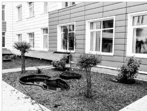
2 место – Хомутовская средняя общеобразовательная школа №1