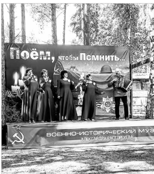
СВО. Коллективы нашего Дома культуры в д. Талька тоже не смогли

Недавно на территории военно-исторического музея Александра Расторгуева, который располагается на полигоне ТБО под Иркутском, прошёл музыкальный фестиваль. Все средства, вырученные от проведения фестиваля, были направлены в поддержку участников