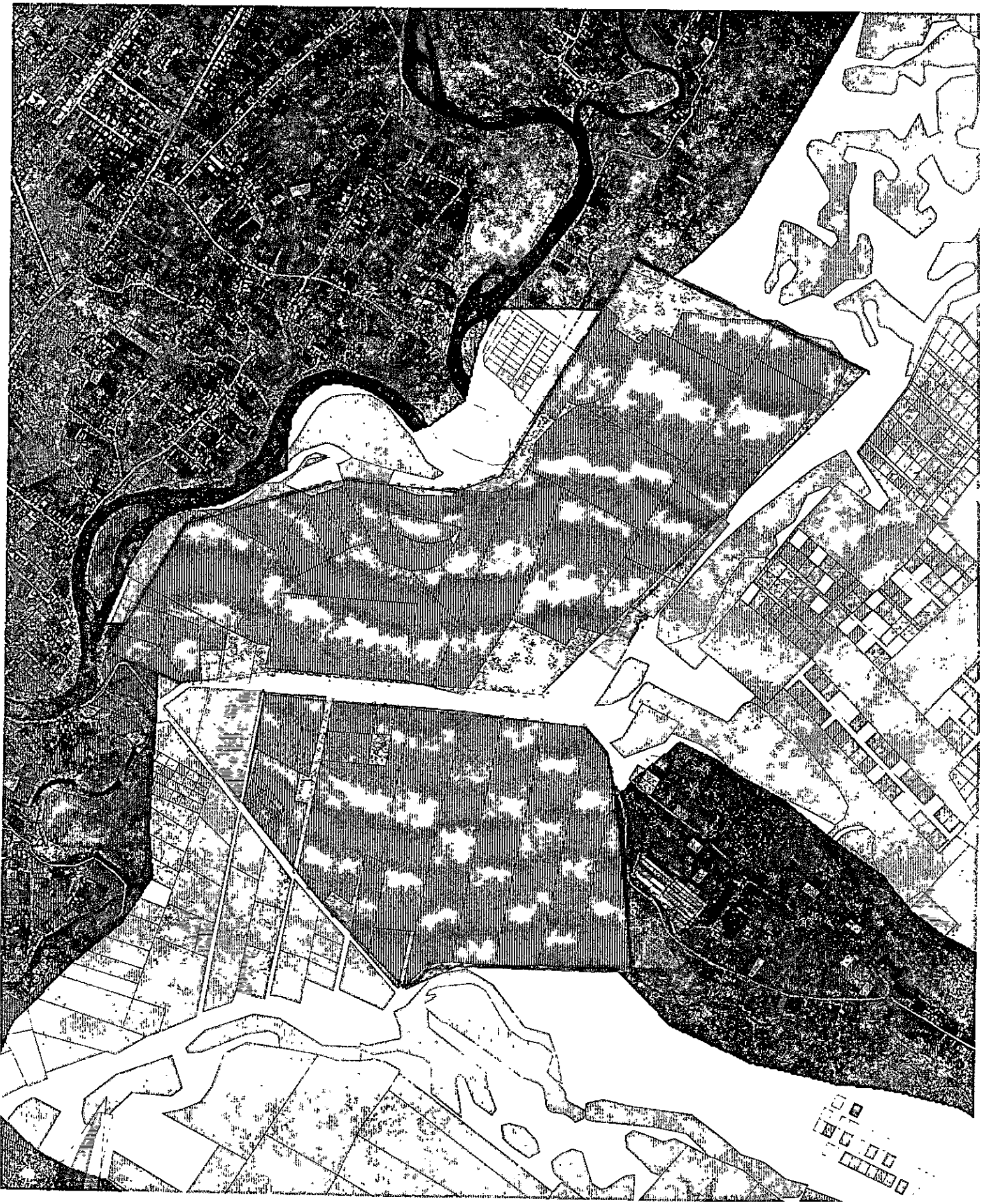
восточная часть с. Хомутово в пойме реки Куда